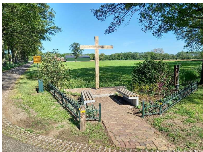
Kruisbeeld vanaf september 2021.

Het onderhoud van het kruis wordt al vanaf de oprichting door de burens zelf verzorgd.