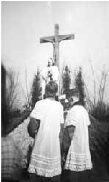
Kruisbeeld van 1947 tot 1971

Dit kruisbeeld werd opgericht door buurtbewoners van De Hemmele.